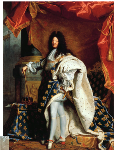
Louis XIV “Le Roi Soleil” 1638-1715

Stimulé par la croissance industrielle, le fer et le verre entrent dans la construction de vastes coupoles des palais des expositions internationales, des gares, du métro et des grands magasins. La Femme inspiratrice, les cabarets, les guinguettes, les affiches de Mucha ou de Toulouse Lautrec enjolivent le quotidien. La comédienne et artiste, Sarah Bernhardt, enflamme le théâtre, l'art nouveau des bijoux. Les estampes japonaises rajeunissent l'imagination des artistes..