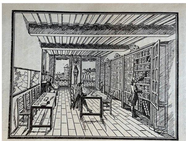
Chambre de lecture 1763

Cette singulière organisation essaima partout en Bretagne, à tel point que le comte de Saint Florentin, ministre d'Etat, sollicitera les commissaires du cercle pour obtenir copie du règlement afin d'inspirer d'autres villes du royaume. Forte de 65 associés, la Chambre de la ville suscite aussi l'intérêt de voyageurs étrangers (Paul Jones, Benjamin Franklin) qui apprécient ce lieu où l'on peut converser et lire les feuilles du jour en toute quiétude.