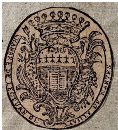
Ex-Libris Chambre de la ville

Nul doute qu'après tant d'épreuves, l'antique chambre de lecture qui compte dans ses rangs des dynasties de membres de la même famille, peut contempler le XX ème avec sérénité... (à suivre).