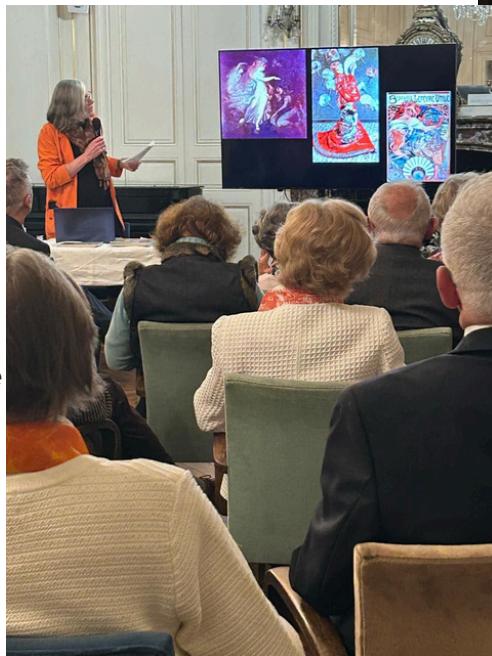
Lautrec, Divan Japonais